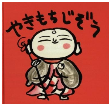
<「やきもちじぞう」表紙・協議会発行物>