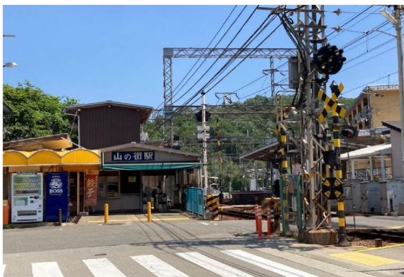
<レトロな佇まいの山の街駅・踏切>