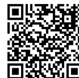
神戸市まちづくり条例

神戸市は、まちづくり基本構想に基づく「まちづくり提案」を受けると、住みよいまちづくりを推進するための施策の策定や実施にあたり、「まちづくり提案」の内容に配慮するように努めなければなりません。